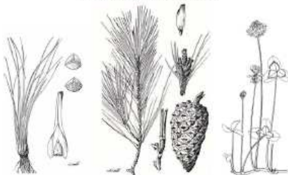
Groupe des Plantes Vasculaires (Trachéophytes)

Service de Floristique - Herbar Régional MARK